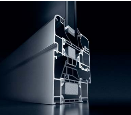
Schüco vindue AWS 70 SL.HI Afrundet Soft Line-vindueskontur, der giver bløde linjer Schüco window AWS 70 SL.HI Rounded Soft Line vent contour for soft lines