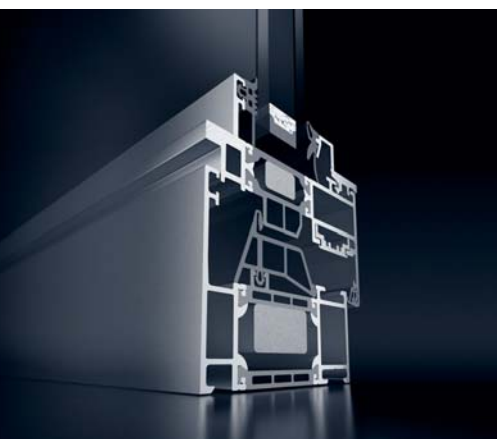
Schüco vindue AWS 70 ST.HI Systemet med det klassiske smalle stål-look Schüco window AWS 70 ST.HI System with classic, narrow steel appearance